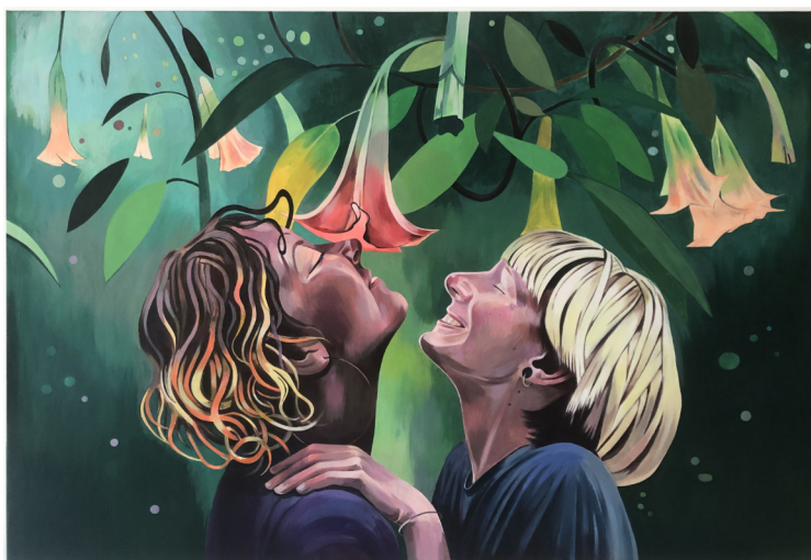
oeuvre de la série "Ready to play?"